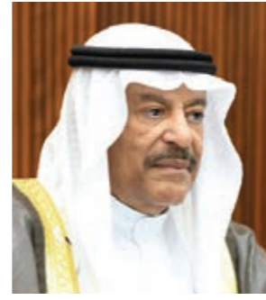
رئيس مجلس الشورى.

ونشر الحقائق والأخبار الموثوقة، وتوعية المواطنين والمقيمين، يعتبر إسهاماً مباشراً في الجهود الوطنية للتصدي للجانحة.