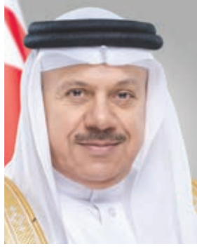
○ وزير الخارجية.

الأمريكي الخاص لإيران، مشيدا بما يتمتع به من كفاءة وخبرة سياسية، متمنيا له التوفيق والنجاح في مهمته الدبلوماسية الجديدة.