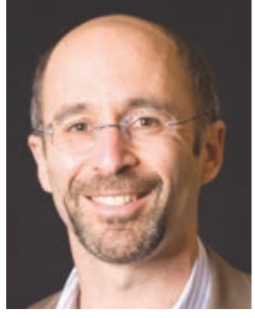
○ المبعوث الأمريكي الخاص.